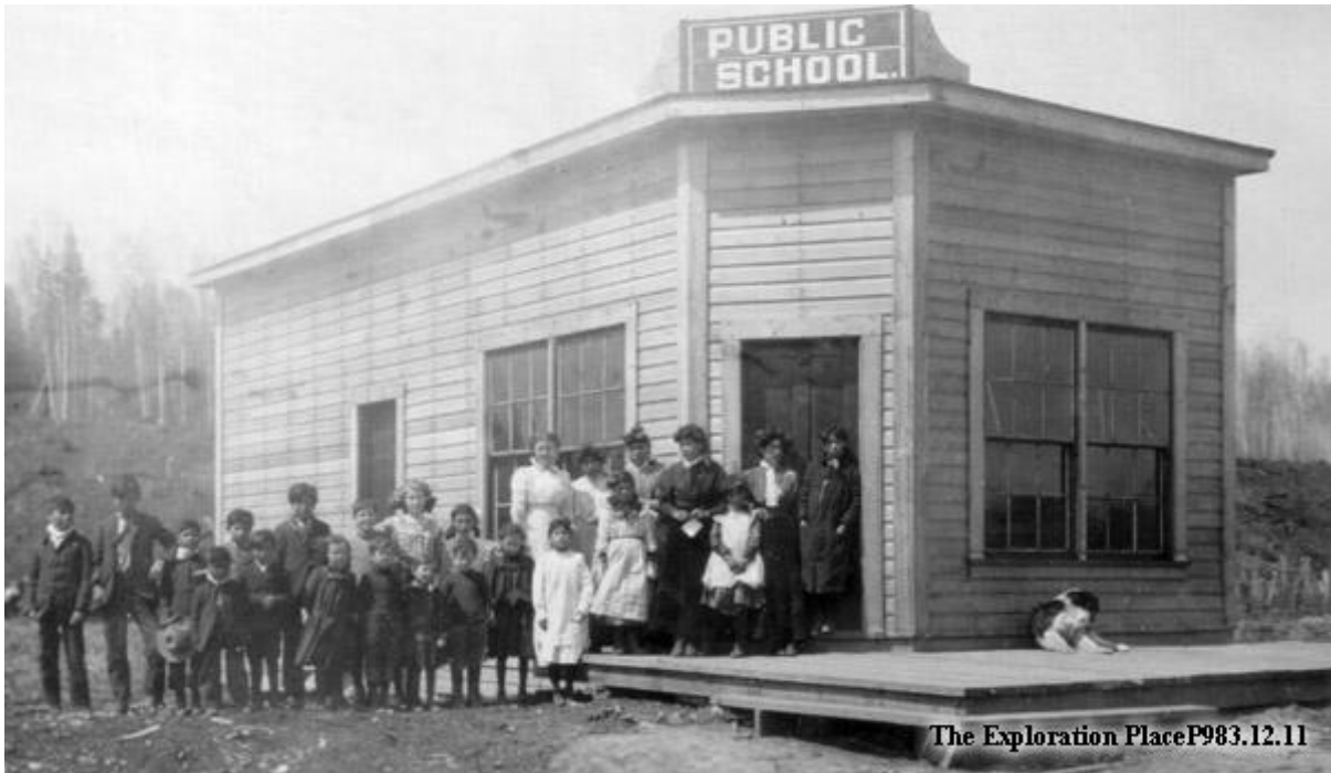
Les premières écoles

Remplis les espaces blancs pendant que l'enseignant ou l'enseignante lit le texte à voix haute.